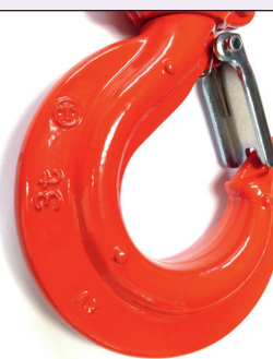
«EZ Check»-krok med patentert trepunkts målesystem

Vi tar forbehold om trykkfeil og fremtidige endringer i spesifikasjoner. Produktene kan avvike noe fra avbildet modell.