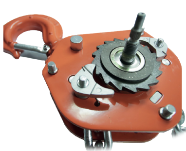
Unikt patentert dobbelt pal-system, designet og produsert av Tiger