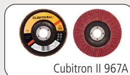
Cubitron II 967A

Lamellrondell 566A gir et allsidig én-skive-system til bruk ved metallfabrikasjon der slitestyrke er nødvendig til middelstung sliping, fjerning av små sveiser, bearbeiding og overflateforberedelser.