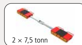
2 x 7,5 tonn