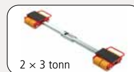
2 x 3 tonn