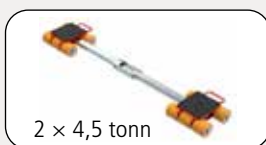
2 x 4,5 tonn