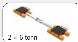
2 x 6 tonn