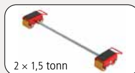
2 x 1,5 tonn

Transportrulle for profesjonell innendørs tunglasttransport på rent og glatt gulv. Design inkluderer justeringstenger, sklisikker gummiplate og polyuretanhjul som er slitesterk og kuttresistent. I kombinasjon med en trekkarm med samme installasjonshøyde danner det et trygt overordnet system med 3 lastpunkter.